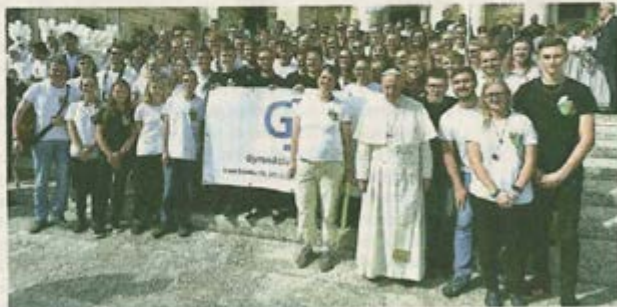
Gymnaziální sbor Mendík zazpíval minulý týden papeži Františkovi i při svatováclavské mši v bazilice sv. Petra.

Pro letošní svatováclavskou připomínku byl film promítán za hudebního doprovodu nahrávky Symfonického orchestru Českého rozhlasu. Ten původní hudbu Oskara Nedbala a Jaroslava Kříčky nově nastudoval poté, co byla v roce 2009 náhodně nalezena partitura k tomuto filmu. (rag, srp)