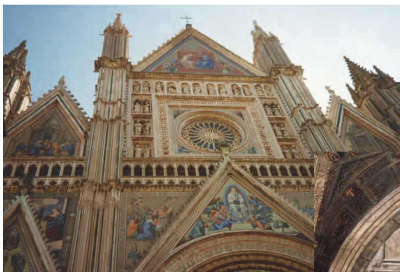
Orvieto. Průčelí katedrály.