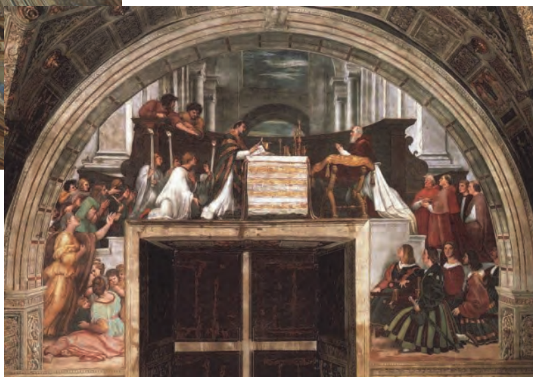
R. Santi: Mše bolsenská. Detail fresky. Vatikán, Stanza d'Eliodoro.