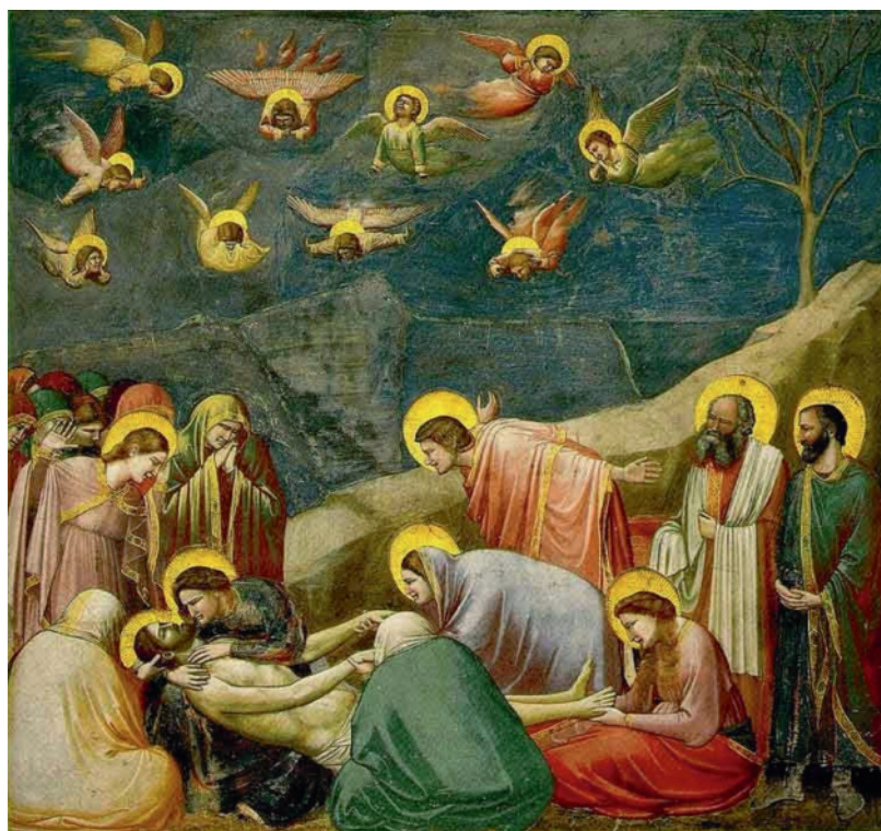
Bědování nad mrtvým Kristem podle Giotta di Bondoneho (1267-1337)

nejkrásnější, který přinášel nejvíc ovoce a byl hospodářovým nejmilejším stromem. Jednoho dne hospodář tomuto stromu řekl: - Tebe velmi potřebuji. Strom se zaradoval, že má takovou výsadu mezi ostatními stromy. - Ale musím tě porazit. - Proč mě? Zdálo se mi, že mne máš nejraděj, když ti